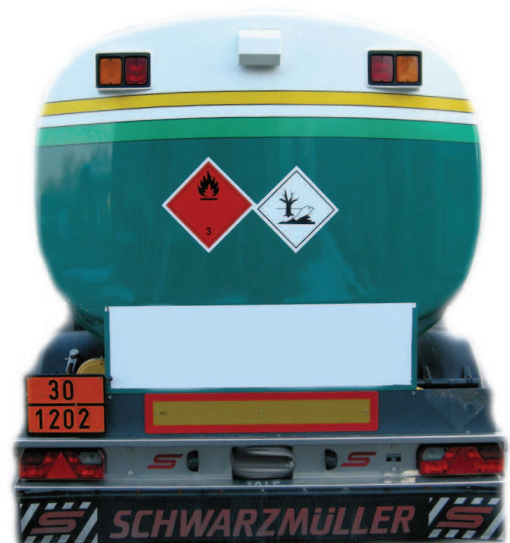
Abb. 2) Anbringen der Kennzeichnung auf kontrastierendem Hintergrund.